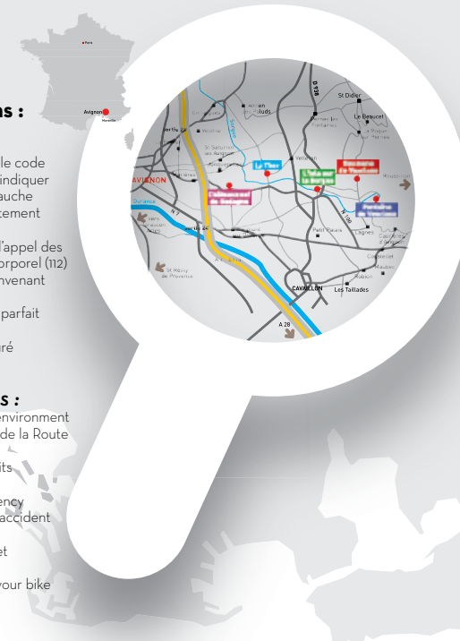
Conception graphique Atelier Réan (0676972018) - Juillet 2016

OFFICE DE TOURISME INTERCOMMUNAL PAYS DES SORGUES MONTS DE VAUCLUSE www.oti-delasorgue.fr